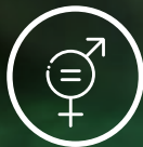
Égalité des genres