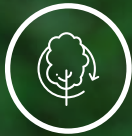
Foresterie durable et agroforesterie