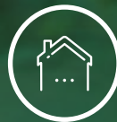
Habitat social et autres services