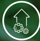
Développement économique local